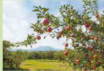
三水地域の一面に広がるりんご畑

上越高田の出身で、料理店の3代目として婿養子に来たんだよ。あちは、米はあったけど、りんごはなくてね。大好きなりんごが町中になっていて、嬉しかったね。この町の「ふじ」は、甘みと酸味のバランスが良くって、おいしいんだよ。土が良いからね。