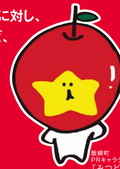
飯網町PRキャラクター「みつどん」

飯網町では、ふるさと納税(寄付)をされた方に対し、心ばかりのお礼としてりんごやもも、お米など、当町の特産品を進呈しています。(町外在住の方で、1回10,000円以上ふるさと納税(寄付)をされた方が対象となります。)詳しくは、総務課総務係026-253-2511(9時~17時)までお問い合わせください。